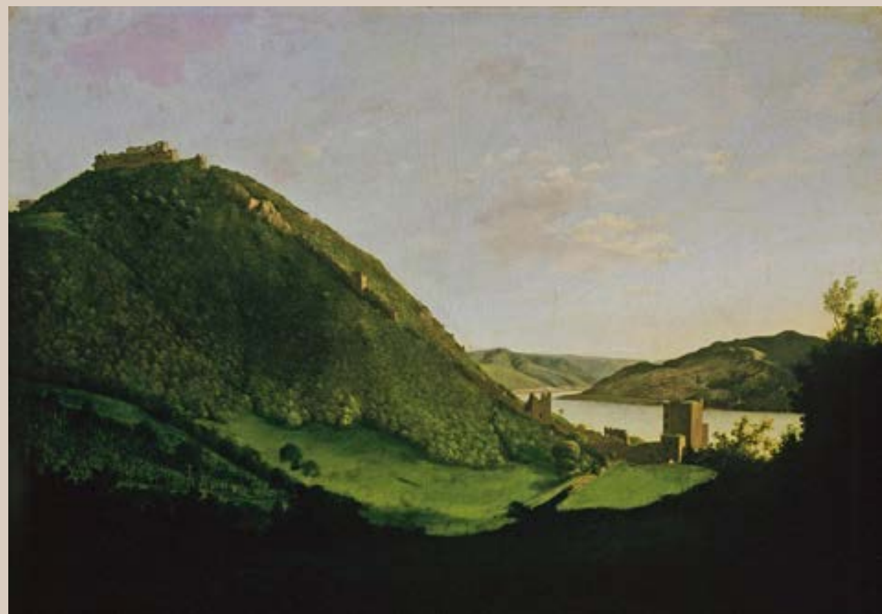
Markó Károly: Visegrád

A művészettörténet számos olyan műről tud beszélni, melyek témája a föld. Már az őskorban megjelentek a törekvések, a környezet ábrázolására. Az idővel ahogy finomodtak a művészi kifejezés eszközei, úgy változott a föld, mint téma megjelenítése is. A helygő, az anyaföld, vagy maga a föld, mint anyag, az idők során mind belekerült valamilyen módon a művészek, és így a művészet bűvkörébe.